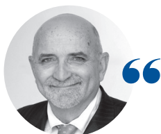
Philippe GAZAGNES Président du tribunal administratif de Clermont-Ferrand

Avec 2 231 affaires enregistrées, la baisse des requêtes (- 13,5 % par rapport à 2019), principalement due à la pandémie, est une première depuis dix ans. La baisse des affaires jugées est plus faible (- 10,6 %), pour les mêmes raisons. La situation du tribunal s'améliore mécaniquement.